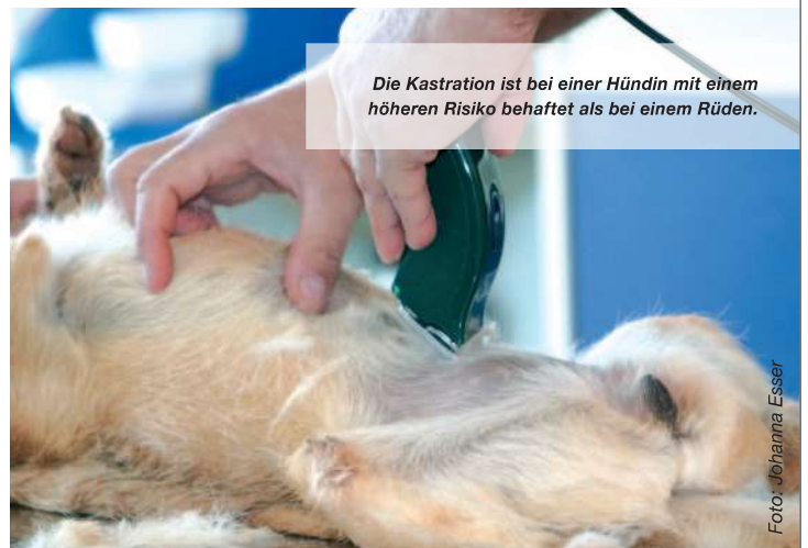
Die Kastration ist bei einer Hündin mit einem höheren Risiko behaftet als bei einem Rüden.

Was aber normalerweise nicht dazu gesagt wird, ist die Frage, wie viele Hündinnen denn überhaupt von Gesäugetumoren befallen werden. Je nachdem, welche Altersgruppe und welche Studie man